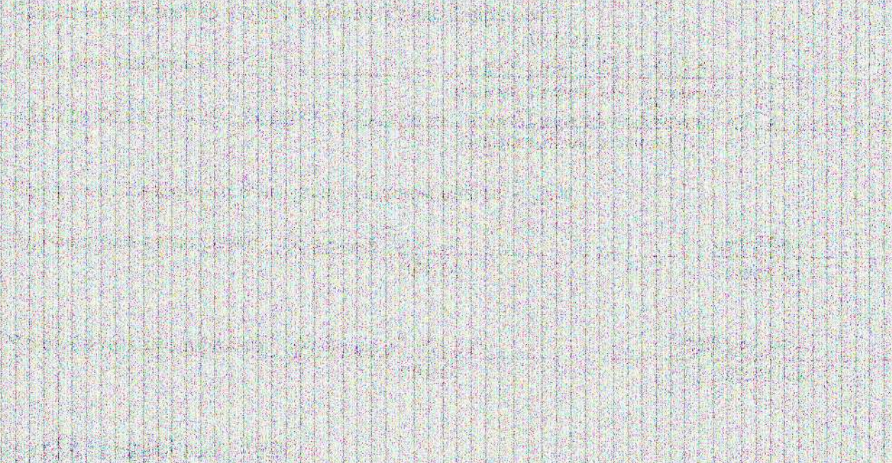
Figure 1: A line graph showing the relationship between the number of people (x-axis) and the number of people (y-axis). The x-axis ranges from 0 to 100, and the y-axis ranges from 0 to 100. The graph shows a linear relationship where the number of people on the y-axis is equal to the number of people on the x-axis.